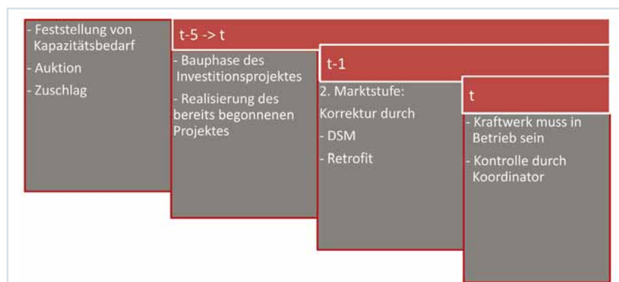
Abb. 2 Schema der Marktstufen des Kapazitätsmarktes

Über die Frage des Marktdesigns eines Kapazitätsmarktes darf der Gesamtzusammenhang nicht aus dem Auge verloren werden: Ein Kapazitätsmarkt – in welcher Ausgestaltung auch immer – vermag nur ein Baustein in einem geänderten Gesamtmarktdesign der Zukunft zu sein. Die Aufgabe der Umgestaltung unseres Energiemarktes zur Integration der erneuerbaren Energien umfasst weit mehr als dieses Marktsegment. Dem Dilemma der Notwendigkeit einer raschen Antwort auf eine komplexe Frage versucht