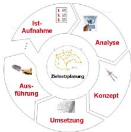
Abb. 2: Projektablauf Zielnetzplanung

Die Ist-Aufnahme nimmt - soweit möglich - ein komplettes Datenbild des bestehenden Netzes auf. BET fragt neben der Liste der Betriebsmittel und im Betrieb verankerten Bewertungskriterien, bestehende Randbedingungen wie wichtige Standorte, definierte Versorgungsqualität und -sicherheit, Instandhaltungsstrategie und Schadensstatistik ab. Mit Hilfe entsprechender Software wird anschließend das Ist-Netz als kalibrierfähiges Rechennetzmodell mathematisch und grafisch dargestellt. Erste Berechnungen zu Lastfluss- und Kurzschlussverhalten folgen.