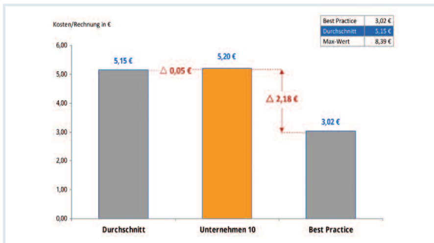
Abb. 3 Ein Kostenbenchmark identifiziert die wesentlichen Kostenunterschiede

Den einfachsten Fall stellt die vom britischen Regulierer Ofgem eingeführte Bezugsgröße „CSV“ [2] dar. In dieser „CSV“ werden Netzlänge, versorgte Einwohner und gelieferte Energiemenge gewichtet und mathematisch verknüpft, so dass eine gemeinsame Bezugsgröße entsteht. Die Praxis zeigt, dass die so berechneten Kennzahlen insbesondere für die Betrachtung von aggregierten Prozessen deutlich bessere Korrelationen und damit belastbarere Aussagen zu den Einsparpotenzialen liefern als Kennzahlen mit eindimensionaler Bezugsgröße. Erst in einem zweiten Schritt werden die Service- bzw. Netzprozesse einzeln betrachtet und einem Kostenvergleich unterzogen. Hierzu wird für jeden Prozess eine möglichst individuelle Bezugsgröße gewählt, die signifikant für die Entstehung bzw. Erklärung der Kosten ist und die spezifischen Prozesskosten über diese Kennzahl ermittelt.