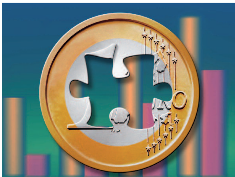
Bei Netzübernahmen ist die Ermittlung des Ertragswertes von Netzen eine zentrale, aber knifflige Angelegenheit

Die Methode der Kaufpreisfindung ist regelmäßig zwischen Übernehmer und abgebendem Netzbetreiber strittig. Die Endschaffungsklauseln der Konzessionsverträge sehen in der Regel einen Netzkaufpreis zum Sachzeitwert vor. Die Strom- bzw. Gasnetz-entgeltverordnungen vom Juni/Juli 2005 (NEV) gehen im Gegensatz hierzu davon aus, dass bei der Ermittlung der kostenbasierten Netzentgelte nicht der Kaufpreis sondern lediglich der kalkulatorische Restwert relevant ist. Um das Wiederaufleben von Abschreibungen zu vermeiden, darf der Netzerwerber den Wert des Anlagevermögens nach Auffassung des Regulierers maximal mit dem Betrag ansetzen, den das abgebende Unternehmen als kalkulatorischen Restwert festgehalten hatte. Ein eventuell höherer Kaufpreis, wie er sich häufig wenn nicht gar